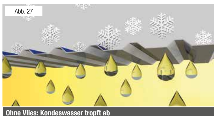
Ohne Vlies: Kondenswasser tropft ab

Die lieferbaren Profiltypen entnehmen Sie bitte der Produktliste WECKMAN-Vliesstoffbeschichtung.